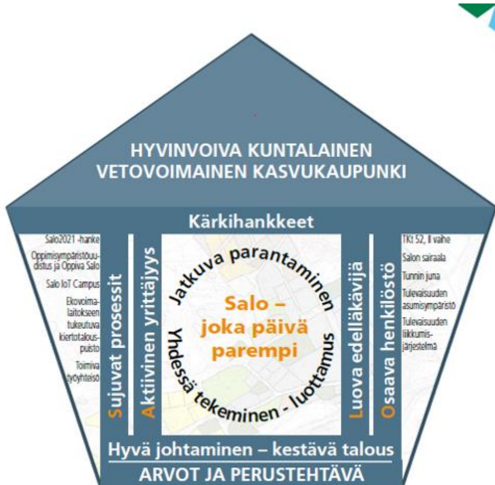
Kuvio 1 Salon kaupungin strategiatalo

Kehitysvammahuollon suunnitelma perustuu Salon kaupungin strategian painopistealueisiin, perustehtävään ja visioon. Taustalla vaikuttaa myös hyvinvointipalveluiden tulokortti.