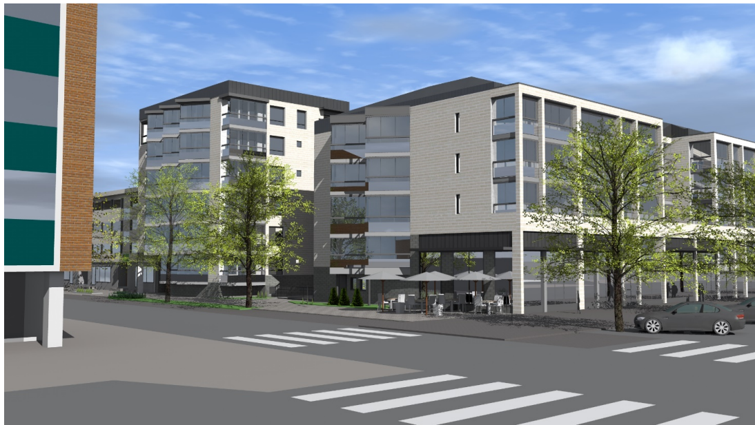
Kuva: Arkkitehtitoimisto C&Co Oy