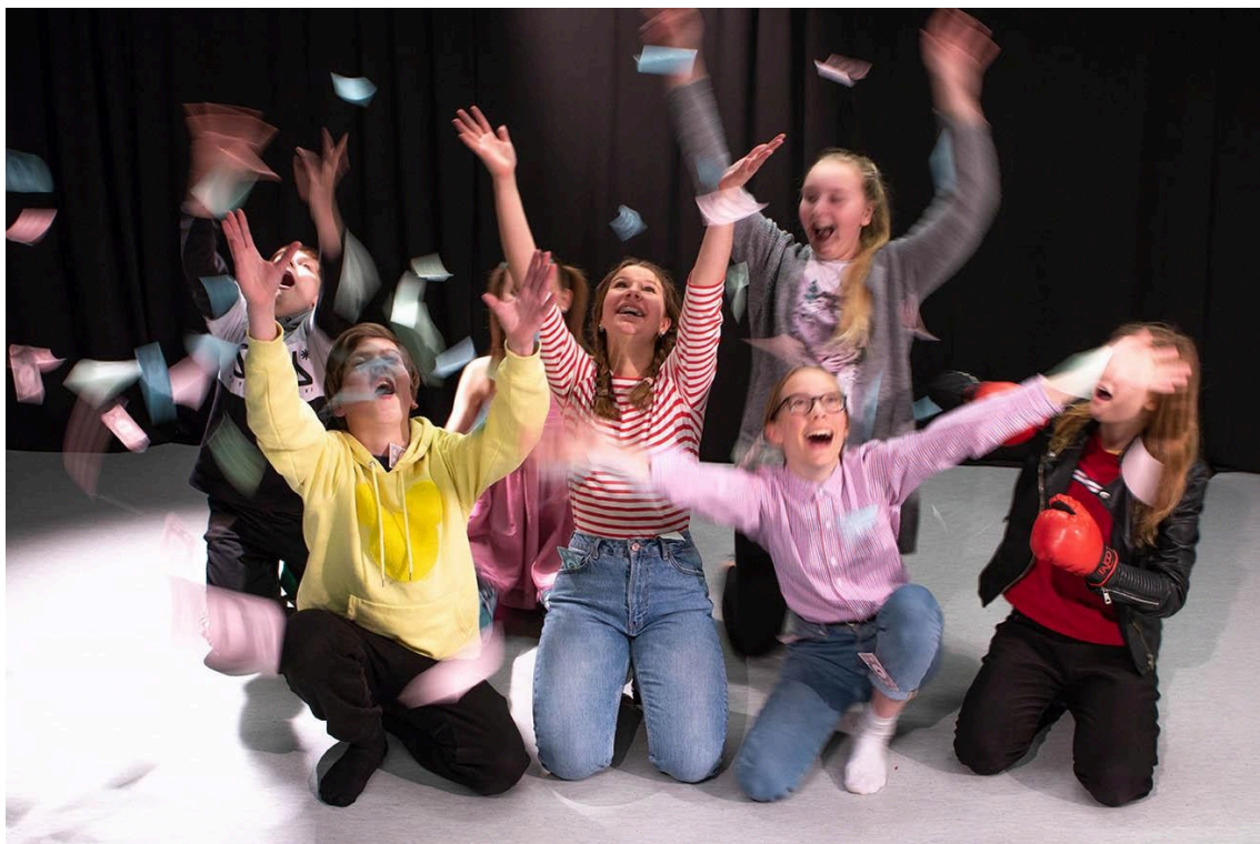
Ella ja jättipotti keväällä 2020.

Taiteen perusopetuksen teatteritaiteen yleisen oppimäärän tehtävänä on vahvistaa oppilaiden aktiivista toimijuutta ja teatteritaiteen ymmärrystä. Opetuksessa tuetaan oppilaita taiteen omaehtoiseen tekemiseen ja henkilökohtaiseen tulkintaan. Opetus kannustaa oppilasta rakentavaan toimintaan yksilönä sekä vuorovaikutukseen ryhmän jäsenenä. Teatteritaidetta voi opiskella eri lähtökohtien, tekemisen tapojen ja näkökulmien kautta, esimerkiksi esiintyjyyden, näyttelijäntaiteen, käsikirjoittamisen, esitysdramaturgian, ohjaajantaiteen ja visualisoinnin kautta. Teatteritaide on luonteeltaan haarautuva ja eri lajeja sisältävä taidemuoto, jossa yhdistyvät eri taiteenalat. Sitä voidaan toteuttaa eri yhteisöissä ja ympäristöissä. Yleisen oppimäärän opetussuunnitelman perusteissa teatteritaide toteutuu erilaisina esityksinä ja esittämisen muotoina.