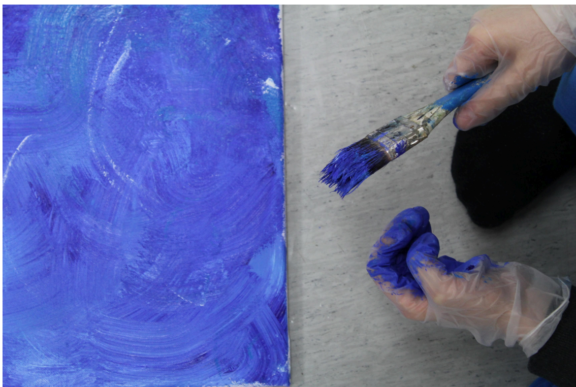
Sinisen maalarin kuvasi Satu Mäkipuro

Kuvataiteen yleisen oppimäärän tehtävänä on tukea oppilaan kasvua, itsetuntemusta, identiteetin rakentumista ja kulttuurista osaamista kuvataiteen keinoin. Opetus vahvistaa oppilaan kokemusta itsestään visuaalisen kulttuurin aktiivisena toimijana sekä luovana ja vastuullisena yhteisön jäsenenä. Opinnot kehittävät visuaalisen havainnoinnin, ajattelun, ilmaisun, tulkinnan ja arvottamisen taitoja sekä luovat edellytyksiä uuden oppimiselle.