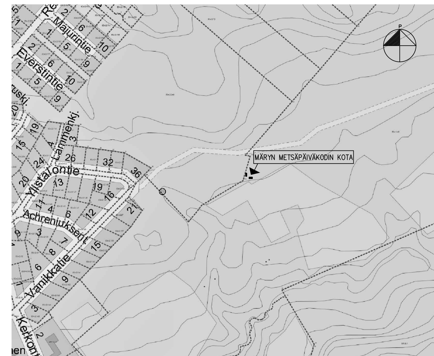
Kuva ei mittakaavassa